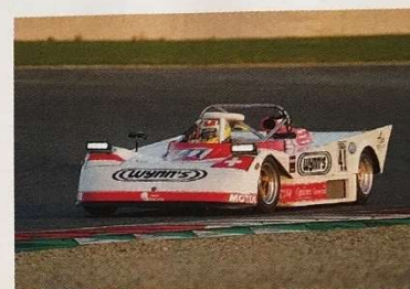
La Tiga SC79 a été malheureusement victime d'une casse d'étrier arrière qui lui a interdit de jouer la gagne. Elle a terminé en troisième position.

fins. L'atmosphère particulière des courses d'endurance était donc parfaitement restituée par cette épreuve, qui constitue, rappelons-le, un préliminaire à la course de 24 Heures prévue du 4 au 6 novembre prochains au circuit Paul Ricard. Abandons, pannes, dépassements et ambiance nocturne étaient au rendez-vous de l'épreuve dont le départ a été donné peu après 18 heures. Au total, 23 équipages se sont affrontés, avec une grande majorité de GT, la marque la plus représentée étant, sans surprise, Porsche.