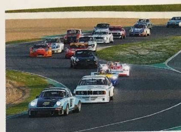
La Porsche 930 de l'équipe Pascalou Racing devant la BMW 635 CSI de la famille Châteaux.