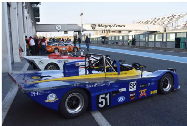
Les dix-sept voitures se placent en pré-grille pour prendre le départ qui aura lieu à 18h13...