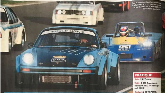
Tour de formation à la vitesse moyenne à la Porsche 930 (4 th ) avec assistance un tour d'annonce sur la BMW 635 CSi de Châteaux Sport auto.

PRATIQUE Date : 25-27 mars Heure : 2 900 € / équipage (si inscrit aux 21 d'horloge) ou 3 900 € Contact : V DE V SPORTS, 11, chemin du Bois, Baudouin, 91220 Brégy sur Orge, tél. 01 89 88 05 24, e-mail : contact@vdx.fr, www.vdx.fr