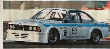
▲ Paul Châteaux n'a eu pas pu voler avec ses fils Jean-Baptiste et Mathieu durant les 2 Tours d'horloge 2022. La 1 re a conduit à développer la BMW 635, très performante sur le sec, qui se classe seconde au sprint à un tour de remorque.