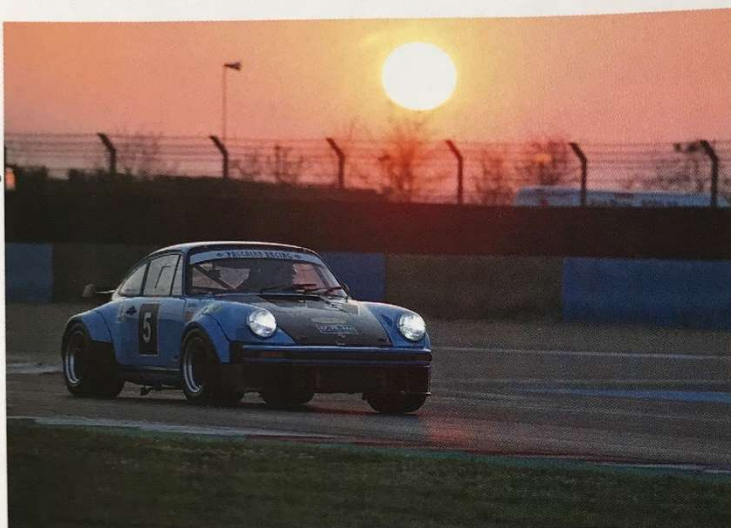
Une magie que seules les courses d'endurance connaissent : le coucher de soleil sur le circuit de Magny-Cours.

Comme si la première manche de l'Historic Tour 2022 ne lui suffisait pas, le circuit de Magny-Cours a été le théâtre de la course d'endurance de 6 Heures organisée par VdeV les 25 et 26 mars. Les pilotes, dont beaucoup participaient également aux courses du Championnat de France historique, s'en sont donné à cœur joie, profitant d'une météo idéale pour s'échanger neuf fois la tête de la course durant les 161 tours de circuit. L'affrontement s'est d'abord joué entre la Porsche 930 Turbo de