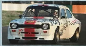
▲ Le Ford Escort du team Flatix 88 sera contraint de remonter une heure avant le départ de l'endurance à l'heure.