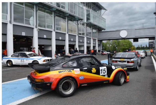
Départ des 6 Heures de Magny-Cours le 16 mai 2021. (Reportage VHC magazine n°5)

Véritable course de préparation pour les écuries et les pilotes en vue de participer aux 2 Tours d'Horloge (l'unique compétition de 24 Heures réservées aux VHC) qui se dérouleront les 4, 5 et 6 novembre sur le circuit Paul Ricard, les 6 Heures de Magny-Cours sont régies par le même règlement technique, avec le même type de voitures acceptées et des équipages pouvant être composés de 2, 3 ou 4 pilotes.