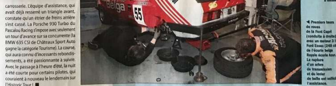
▲ Premiers tours de course de la Ford Capri (conduite à droite) avec un moteur 2 l Ford Essex (240 ch) de l'écurie belgo-française Kevr. La rupture d'un arbre de transmission et du bras de la boîte est sollicité l'assistance.